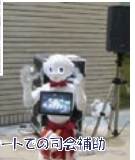
売店などでの案内や患者さまとのふれあい